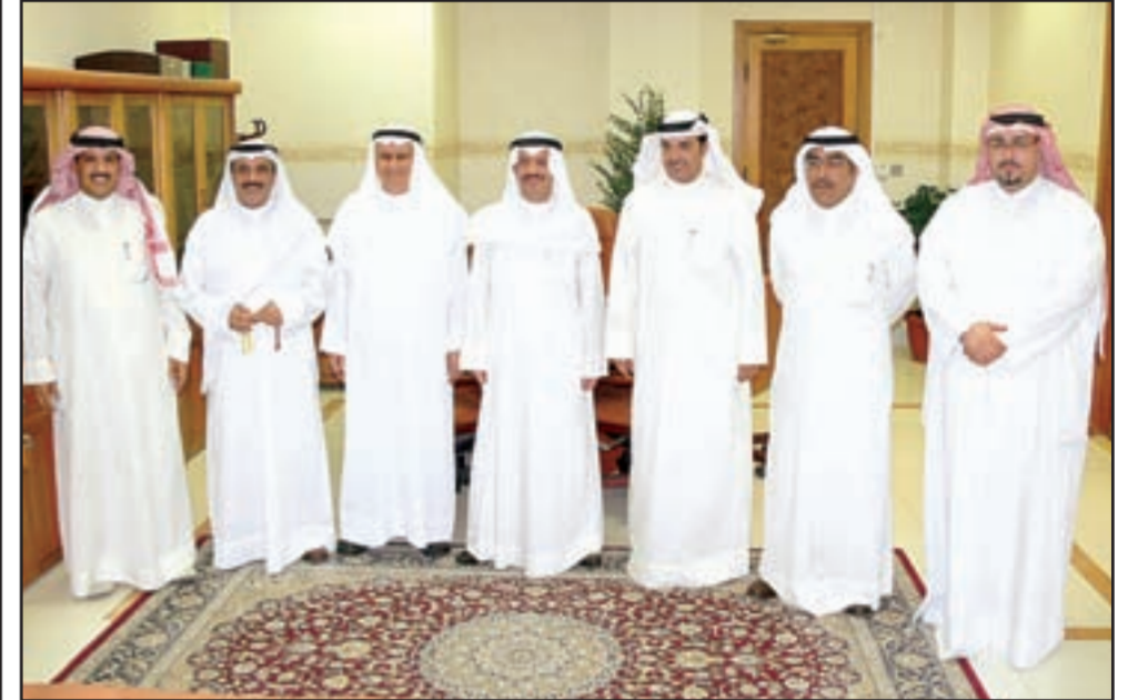
المستشار حامد العثمان ووفد جمعية الصحافيين

«كونا»: ثمنت جمعية الصحافيين الكويتية قرار النائب العام بإعادة تشكيل نيابة جناح الصحافة والنشر وتسميتها بنيابة شؤون الإعلام والمعلومات والنشر.